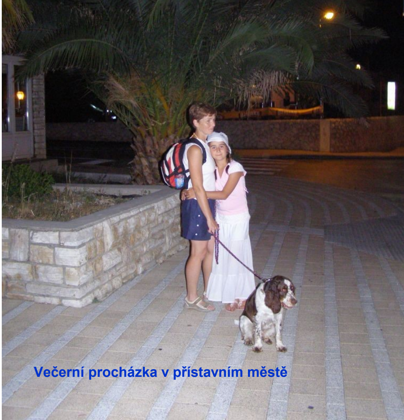
Večerní procházka v přístavním městě